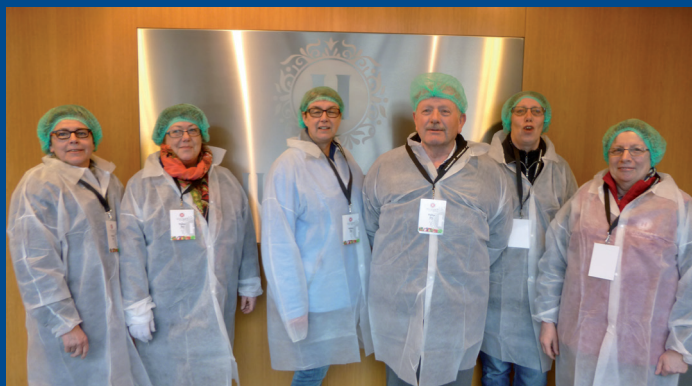
De CCR op werkbezoek bij Huuskes.