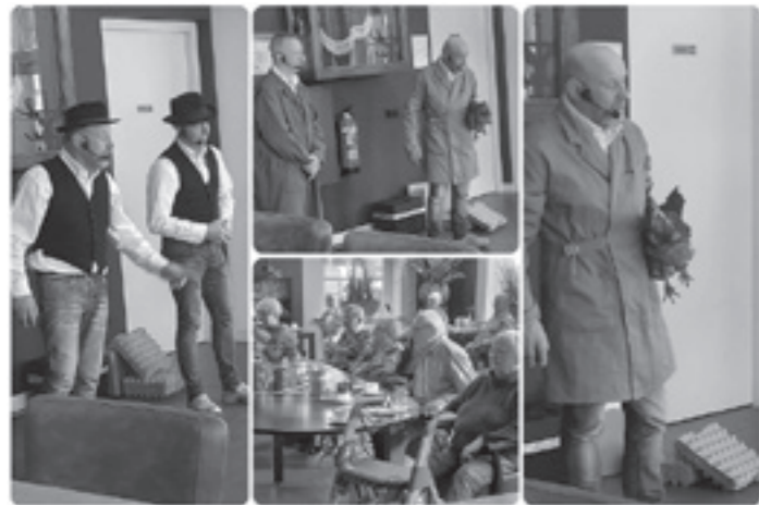
Donderdag 24 maart - Ambthuis